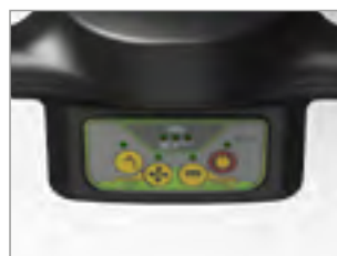
ZAPROGRAMOWANE TRYBY PRACY