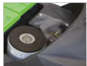
3-STOPNIOWY SILNIK SSĄCY